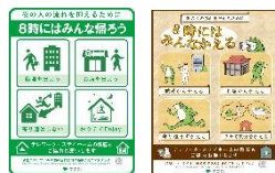
「8時にはみんな帰ろう」コンテンツ

「8時にはみんな帰ろう」を幅広く呼びかけるため、事業者等で活用可能なコンテンツを制作・配布