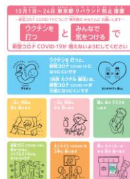
「やさしい日本語」によるイラスト