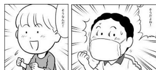
ワクチンについての知識等をPRするマンガ