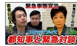
インフルエンサーとの対談