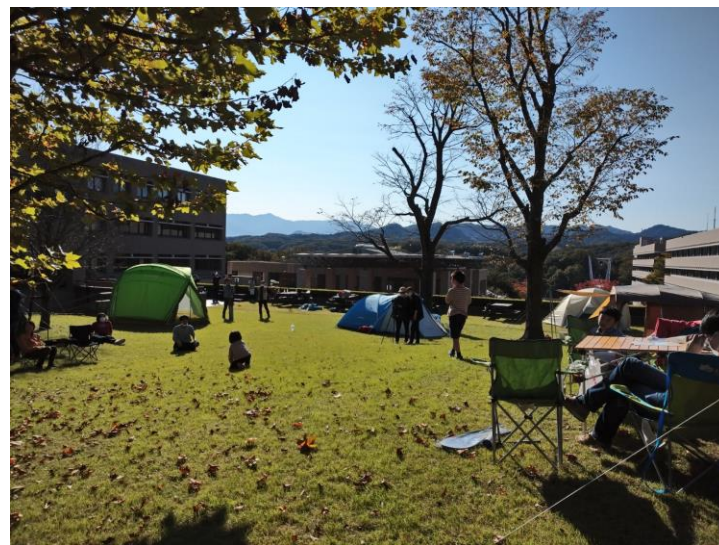
※大学キャンパスでの実証実験の様子