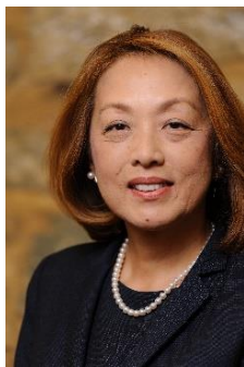
ビジネスプラン発表会 講演者