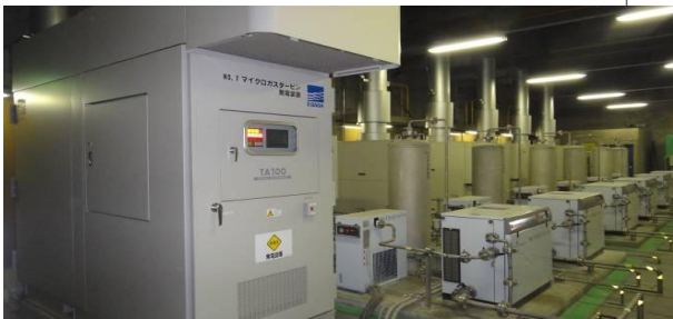
マイクロタービン発電機