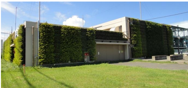
ガス有効利用施設発電機棟