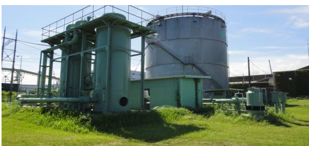
集ガス施設付帯設備(脱硫器・ガス貯留設備)