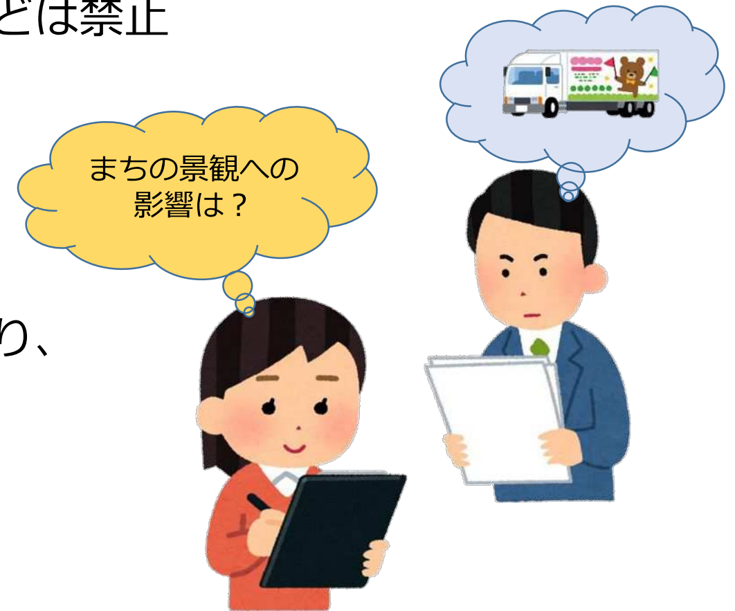
デザイン審査のイメージ