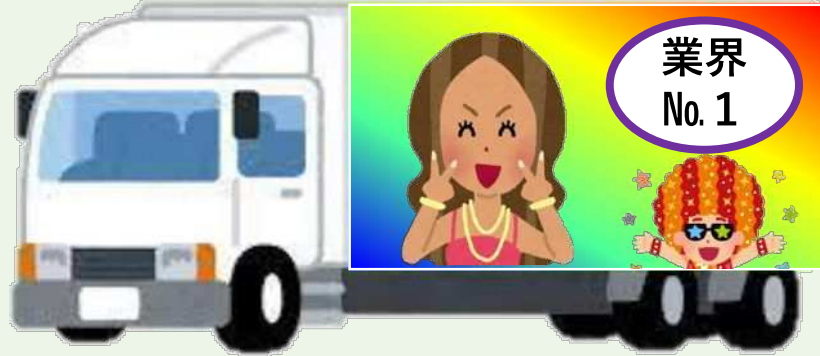
(例) 派手な色遣いを伴う表示