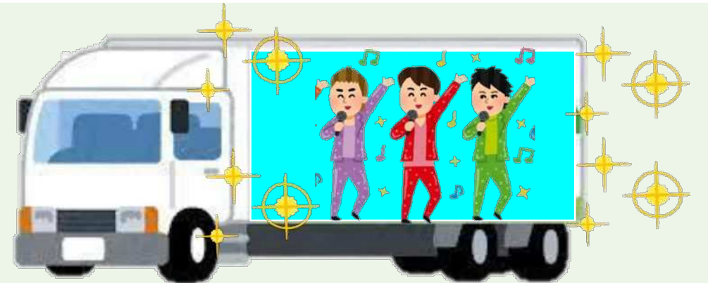
(例) 過度な発光を伴う表示